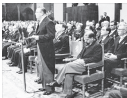
De ondertekening van het Statuut in 1954 door toenmalig premier Efraim Jonckheer. Op de andere foto zit Dòktor da Costa Gomez naast Jonckheer (staand). Het was Dòktor die een belangrijke bijdrage leverde aan het Statuut en wrang dat hij die uiteindelijk niet zelf ondertekende.